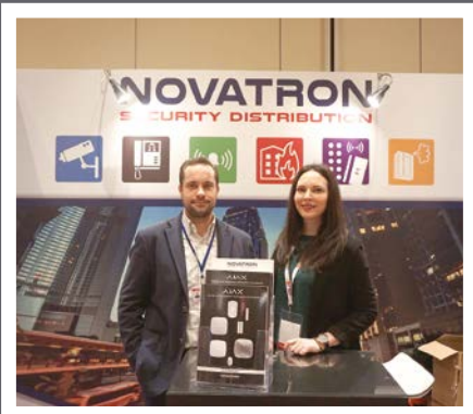
Novatron Security Distribution