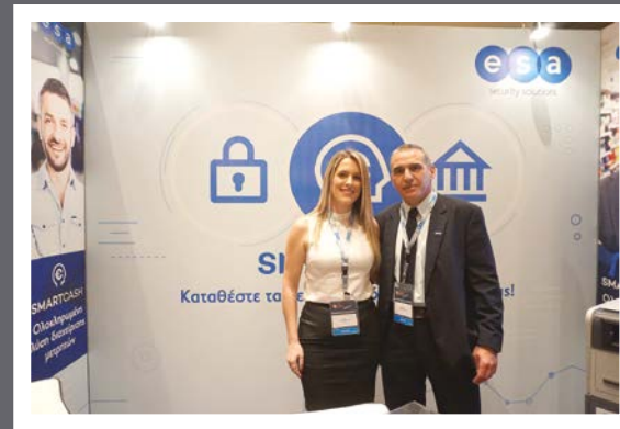
ESA Security Solutions