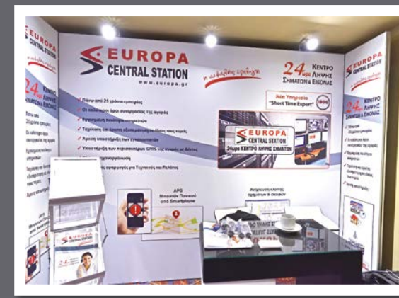
Europa Central Station