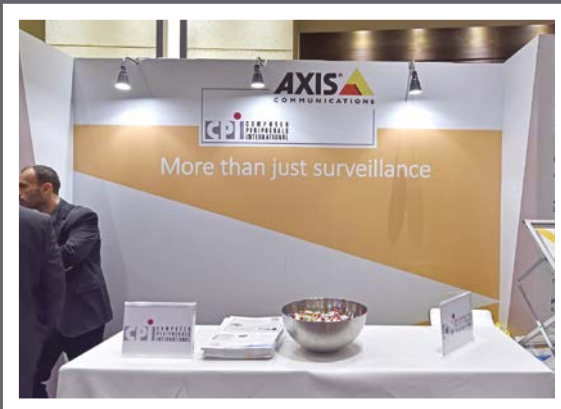
CPI & AXIS