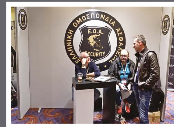
Ελληνική Ομοσπονδία Ασφάλειας