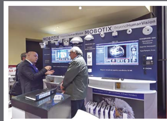
AA Alarm & Robotix