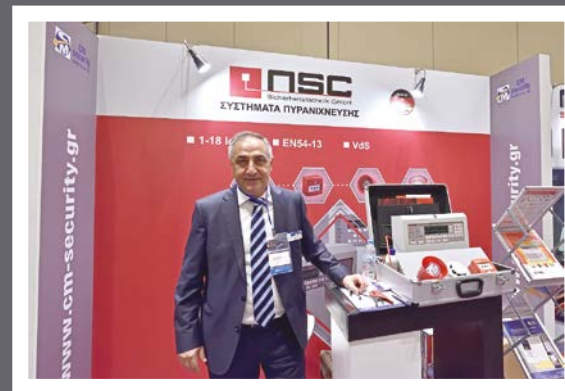
CM Security & NSC