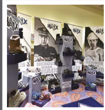
Neomed & Haix