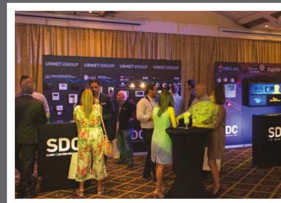
Security Distribution Center