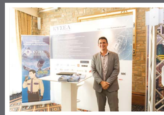
ΚΥΣΕΑ - Κυπριακός Σύνδεσμος Επιχειρήσεων Ασφάλειας