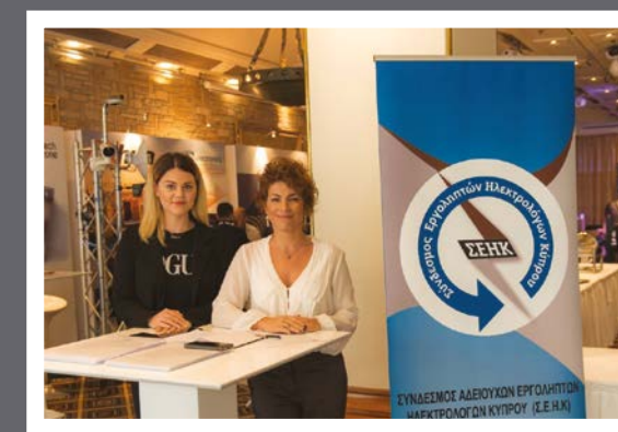
ΣΕΗΚ - Σύνδεσμος Αδειούχων Εργοληπτών Ηλεκτρολόγων Κύπρου